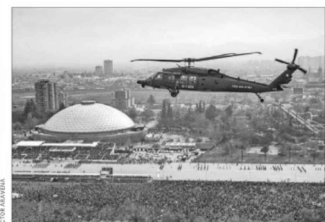
Los nuevos helicópteros Black Hawk de la Fuerza Aérea fueron una de las novedades. Sobrevolaron lentamente la elipse y captaron la atención.