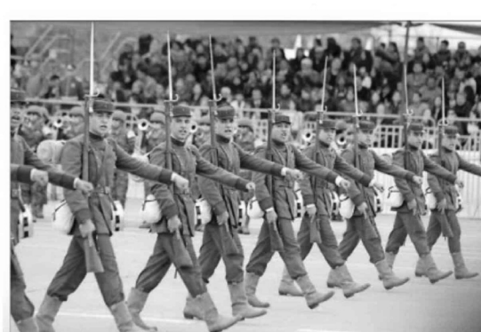
La 4ª Compañía Histórica del Regimiento N° 6 "Chacabuco" en su paso por la elipse.

El Ejército, en tanto, rememoró su historia con el desfile del Piquete Granadero de Infantería 1810, la Compañía de Infantería 1905 y la 4ª Compañía histórica del regimiento “Chacabuco”. Además, desfilaron 12 unidades bicentenarias.