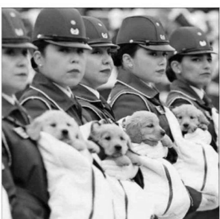
La unidad canina de Carabineros se robó las miradas. Nueve uniformadas marcharon junto a cachorros que, luego de su adiestramiento, estarán a disposición de las fuerzas policiales.

Autoridades de gobierno destacaron la participación femenina en el desfile, que contó con una capitán a cargo de una compañía de alumnos de la Escuela Militar y la primera mujer en el Tambor Mayor de Carabineros.