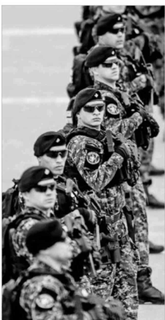
La policía marítima de la Armada se encarga de resguardar la seguridad en los puertos estatales y privados. En la foto, el grupo de respuesta inmediata.

MÁS DE MIL De los casi nueve mil efectivos de todas las ramas de las Fuerzas Armadas que marcharon, 1.300 fueron mujeres.