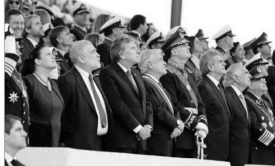
Las autoridades de Gobierno, del Congreso y del Poder Judicial observaron atentamente el paso de las cuadrillas aéreas desde la tribuna.