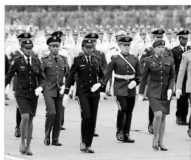
Delegaciones extranjeras de distintos países de Centro y Sudamérica participaron del desfile.