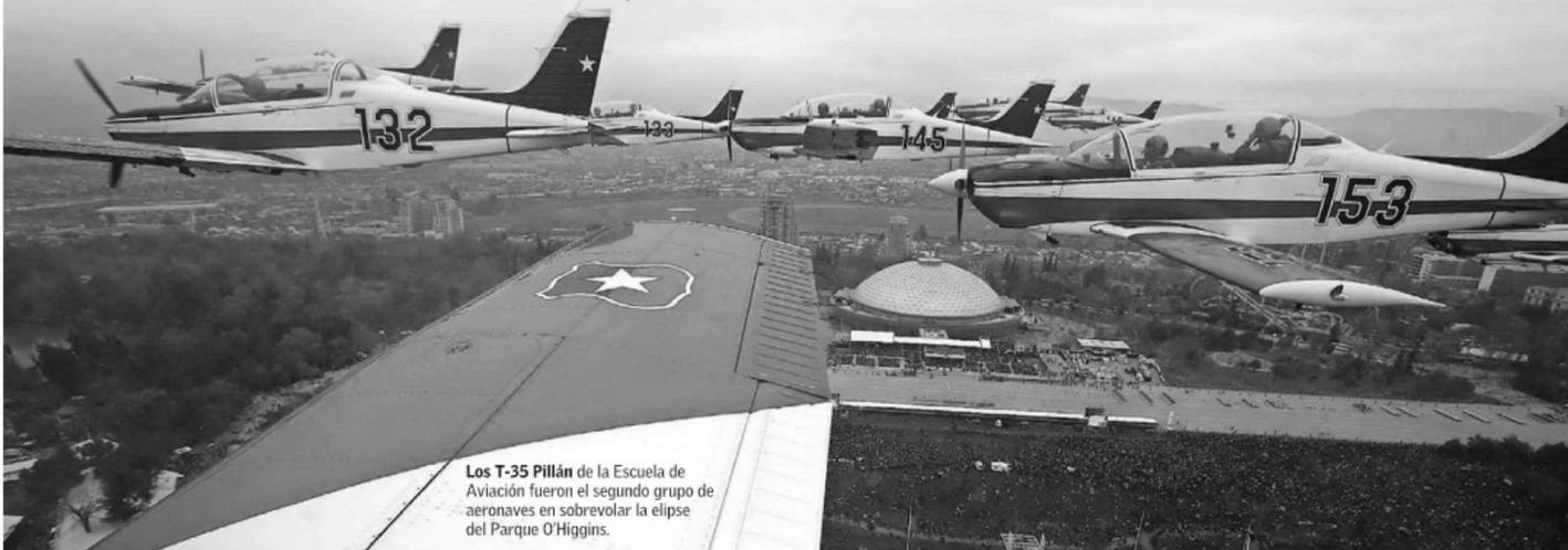
Los T-35 Pillán de la Escuela de Aviación fueron el segundo grupo de aeronaves en sobrevolar la elipse del Parque O'Higgins.