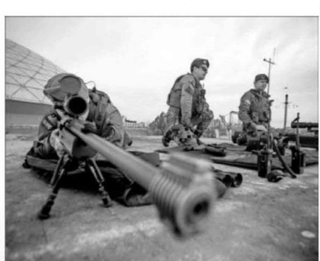
La seguridad estuvo a cargo de efectivos del Ejército que monitorearon el evento desde el techo de la tribuna norte de la elipse.