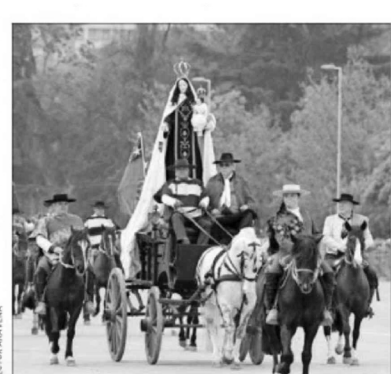
La imagen de la Virgen del Carmen conmemoró los 200 años de la promesa de construir un santuario donde se selló la independencia, el 14 de marzo de 1818.